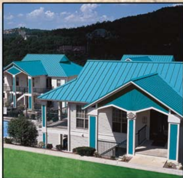
■ アークティック使用例